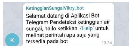
Gambar 6: Verifikasi

Pada tahapan verifikasi ini untuk menentukan apakah alat sudah berhasil terkoneksi dengan internet dan Database. Jika alat berhasil terkoneksi dengan internet dan daya maka alat tersebut akan aktif atau dapat di akses. Jika proses verifikasi ini sukses maka alat akan merespond dan akan mengirimkan notifikasi ke telegram