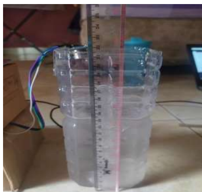
Gambar 5: Hasil Pemasangan Sensor Ultrasonik

Setelah selesainya perancangan dan pembuatan alat dari beberapa komponen, selanjutnya adalah pengujian pada tiap-tiap komponen alat seperti Sensor Ultrasonik, Sensor Rain Drop, Buzzer dan Lampu Led, pengujian output yang dihasilkan oleh microcontroller, pengiriman notifikasi ke telegram, dan pengukuran delay pengiriman perintah dan notifikasi. Pemasangan alat ini diletakan pada penampung air (wadah) yang diletakan di bawah Sensor Ultrasonik.