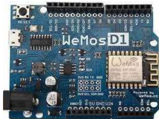
Gambar 1: Arduino UNO

Wemos D1 Wifi Arduino ESP8266 merupakan board mikrokontroler yang dibuat oleh Wemos dan didesain mirip dengan board arduino uno. Keunikan board Wemos D1 Wifi Arduino ESP8266 adalah kompatibilitasnya dengan Arduino IDE, jadi dapat menggunakan Arduino IDE untuk membuat atau mengcompile program dan mengunduhnya ke board ini. Dengan Modul Wifi ESP8266 EX memiliki prosesor 32bit / 80-160MHZ, flash atau program memori 4MB, SRAM 32KB & DRAM 80KB tentunya dengan fitur Wifi 2,4GHZ menjadikan Wemos D1 Wifi Arduino ESP8266 sebagai board yang sangat powerfull dan cocok untuk internet of things.