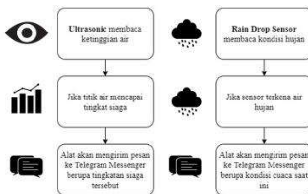
Gambar 2: Proses Kerja Sistem

Berdasarkan masalah tersebut, dari hasil penelitian ke sungai/kali pesanggrahan dan dari hasil penelitian tersebut sehingga peneliti membuat microcontroller pendeteksi banjir yang dapat membantu warga untuk mengantisipasi terjadinya banjir secara tiba-tiba.