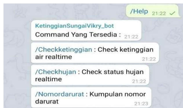
Gambar 7: Notifikasi Command Help

Pada proses ini user memasukan perintah ke telegram berupa “/Help” untuk melihat seluruh command yang tersedia pada bot , “/Checkketinggian” untuk mengetahui ketinggian air sungai/kali secara langsung (Real Time), “/Checkhujan” untuk melihat kondisi cuaca secara Real Time, “/Nomordarurat” untukantisipasi jika dalam keadaan darurat yang diperlukan oleh warga sekitar . Jika perintah “/Help” diinput ke bot telegram , maka alat akan mengirimkan notifikasi seluruh command yang tersedia pada bot.